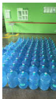
Água Mineral Image 2025-04-03 at 10.33.49.jpeg 125K