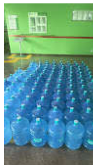
Água Mineral Image 2025-04-03 at 10.33.49.jpeg 125K