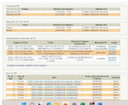
02_IRP-Serviços Gráficos.jpg 268K