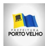
PREFEITURA DE PORTO VELHO