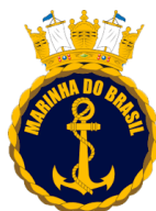
MARINHA DO BRASIL