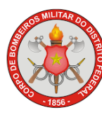
CORPO DE BOMBEIROS MILITAR DO DF