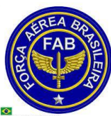
FORÇA AÉREA BRASILEIRA