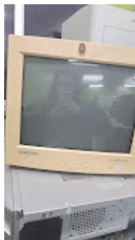
WhatsApp Image 2025-06-12 at 09.55.07.jpeg 97K

Direção Geral - IFAM CCO <diretorcoari@ifam.edu.br>