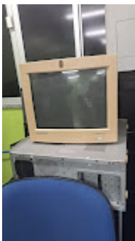
WhatsApp Image 2025-06-12 at 09.55.21.jpeg 136K