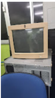
WhatsApp Image 2025-06-12 at 09.55.21.jpeg 136K