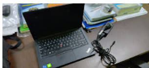
WhatsApp Image 2025-06-05 at 18.06.40.jpeg 69K