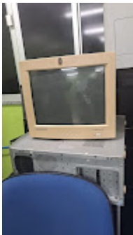
WhatsApp Image 2025-06-12 at 09.55.21.jpeg 136K