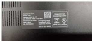
WhatsApp Image 2025-06-05 at 18.06.59.jpeg 75K