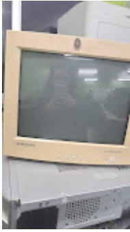
WhatsApp Image 2025-06-12 at 09.55.07.jpeg 97K

Setor de Patrimônio - IFAM CCO <patrimonio.cco@ifam.edu.br> Para: Direção Geral - IFAM CCO <diretorcoari@ifam.edu.br> Cc: DAP - IFAM CCO <dapcoari@ifam.edu.br>