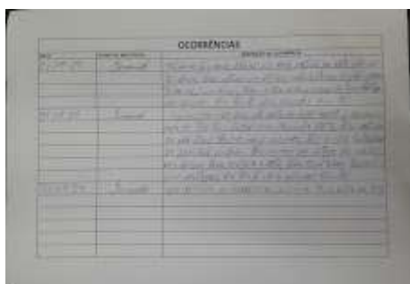
WhatsApp Image 2024-09-25 at 09.23.42 (1).jpeg 82K