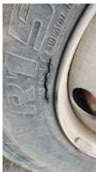
WhatsApp Image 2025-07-03 at 09.04.10.jpeg 181K