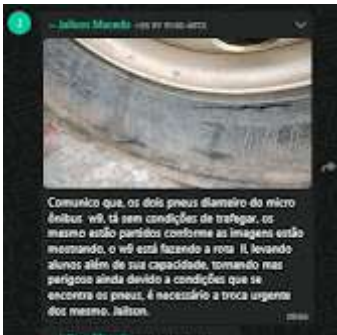
WhatsApp Image 2025-07-03 at 15.42.37.jpeg 33K