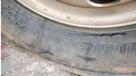
WhatsApp Image 2025-07-03 at 09.04.09.jpeg 203K