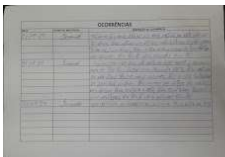
WhatsApp Image 2024-09-25 at 09.23.42 (1).jpeg 82K