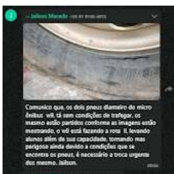
WhatsApp Image 2025-07-03 at 15.42.37.jpeg 33K