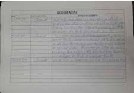
WhatsApp Image 2024-09-25 at 09.23.42 (1).jpeg 82K