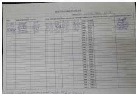
WhatsApp Image 2024-09-25 at 09.23.42.jpeg 117K