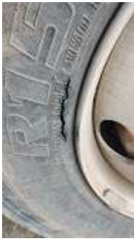
WhatsApp Image 2025-07-03 at 09.04.10.jpeg 181K