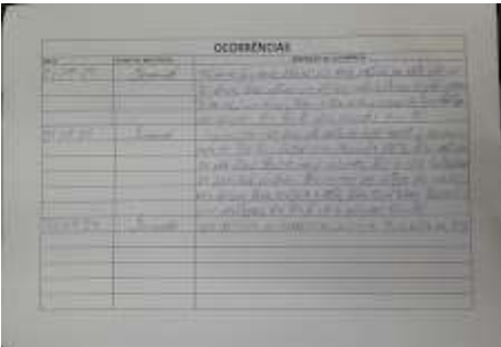
WhatsApp Image 2024-09-25 at 09.23.42 (1).jpeg 82K