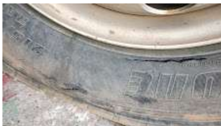
WhatsApp Image 2025-07-03 at 09.04.09.jpeg 203K