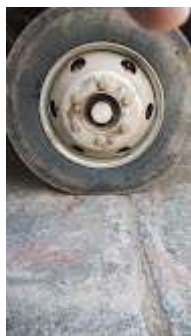
WhatsApp Image 2025-07-03 at 09.04.11.jpeg 232K