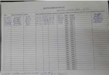
WhatsApp Image 2024-09-25 at 09.23.42.jpeg 117K