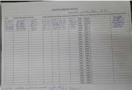
WhatsApp Image 2024-09-25 at 09.23.42.jpeg 117K