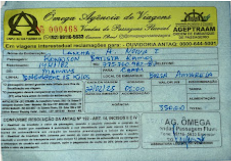
PASSAGEM FLUVIAL_VOLTA.jpg 349K