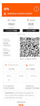
PASSAGEM AÉREA_IDA.jpg 60K